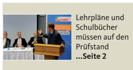
Lehrpläne und Schulbücher müssen auf den Prüfstand ...Seite 2

Informationsmagazin der Ost- und Mitteldeutschen Vereinigung der CDU Nordrhein-Westfalen | Ausgabe 01/2019