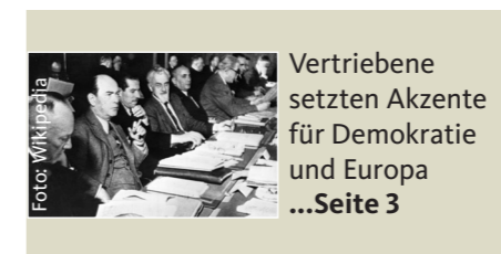
Vertriebene setzen Akzente für Demokratie und Europa ...Seite 3