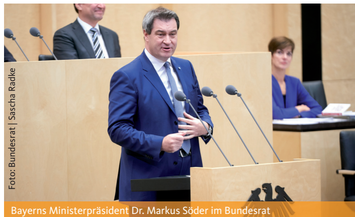
Bayerns Ministerpräsident Dr. Markus Söder im Bundesrat

Düsseldorf. Die OMV der CDU NRW hat den Beschluss des Bundesrates begrüßt, in dem die Bundesregierung aufgefordert wurde, die rentenrechtliche Vorgaben bei Spätaussiedlern neu zu bewerten. „Mit der Zustimmung zum Entschließungsantrag des Freistaates Bayern wurde auch ein Parteitage der CDU NRW umgesetzt, den die OMV initiiert hatte. Darin wurde unsere Mutterpartei aufgefordert, sich für eine verbesserte Anrechnung der im Herkunftsland erworbenen Rentenansprüche einzusetzen. Dies haben wir mit Hinblick auf dro-