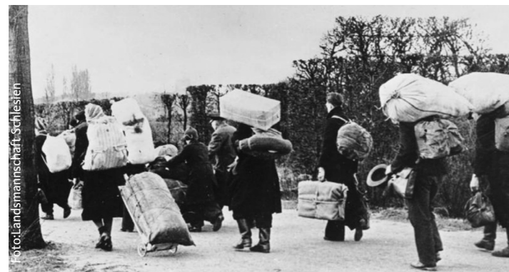
Nur ein bißchen Hab und Gut zum Mitnehmen: Vertreibung aus Schlesien

Erinnerungskultur wird ohne das Wissen um die Themen Flucht und Vertreibung nicht funktionieren. Deshalb kommt es insbesondere auf die Wissensvermittlung im Schulunterricht an. Doch gerade bei den Schulbüchern gibt es Defizite. Beispiele dafür hat der Arbeitskreis der OMV NRW unter der Leitung von Werner Jostmeier herausgearbeitet (Infobox rechts). Bei Neuauflagen oder Neueinführungen sollte daher die Darstellung der Themen Flucht und Vertreibung kritisch geprüft und im Sinne einer wahrhaftigen Geschichtsvermittlung evaluiert werden. Ebenfalls in den Lehrplänen sieht die OMV NRW Optimierungsbedarf. So wird das Thema Flucht und Vertreibung in den Lehrplänen der Sekundarstufen I und II durchaus behandelt. Es sind aber kontextuale Defizite zu erkennen, die den Blick auf dieses umfangreiche Thema verengen. Hier böte die Umstellung auf G9 die Gelegenheit, Korrekturen vorzunehmen. Im Kernlehrplan der Sekundarstufe II wird das Thema Flucht und Vertreibung im Inhaltsfeld „Na-