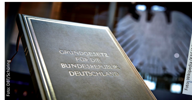
Auch Vertriebene arbeiteten an der neuen Verfassung für Deutschland mit

Als das vom Krieg zerrüttete Deutschland wirtschaftlich und moralisch am Boden lag, standen in Bonn am Rhein Frauen und Männer für ein neues und demokratisches Deutschland eine Verfassungsordnung zu erarbeiten. Unter diesen Frauen und Männern waren auch Persönlichkeiten aus den deutschen Ostprovinzen, die 1945 unter polnische Verwaltung gestellt worden waren. An dem Grundgesetz für die Bundesrepublik Deutschland – es sollte eigentlich ein Provisorium werden – arbeiteten insbesondere zwei Vertreter aus der nordrhein-westfälischen Paten- und Partnerregion Oberschlesien. Hans-Christoph Seebom kam aus Emanuels- gen in Landkreis Pleß. Der