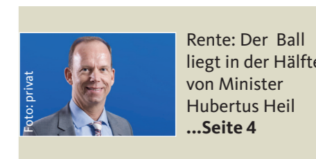
Rente: Der Ball liegt in der Hälfte von Minister Hubertus Heil ...Seite 4